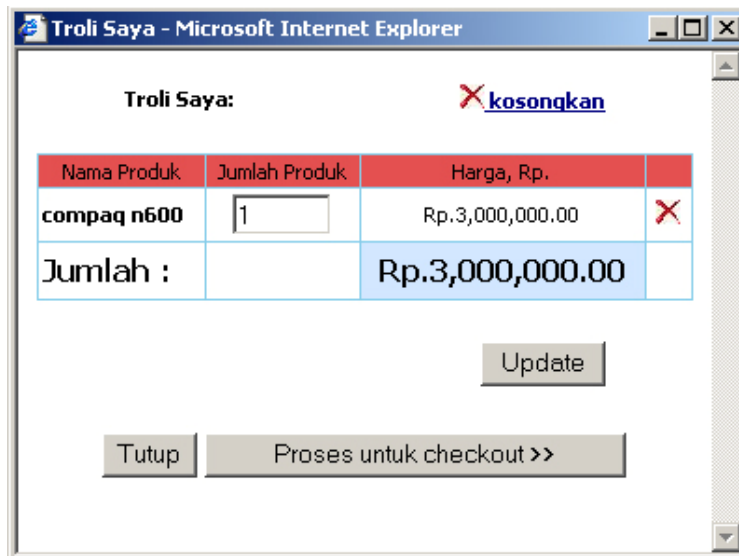
Gambar 1.3 Proses checkout