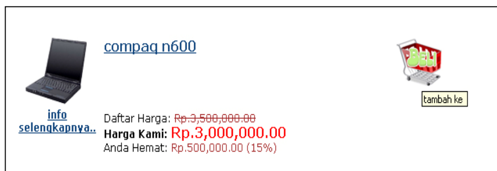
Gambar 1.2 Pemilihan produk dari menu katalog