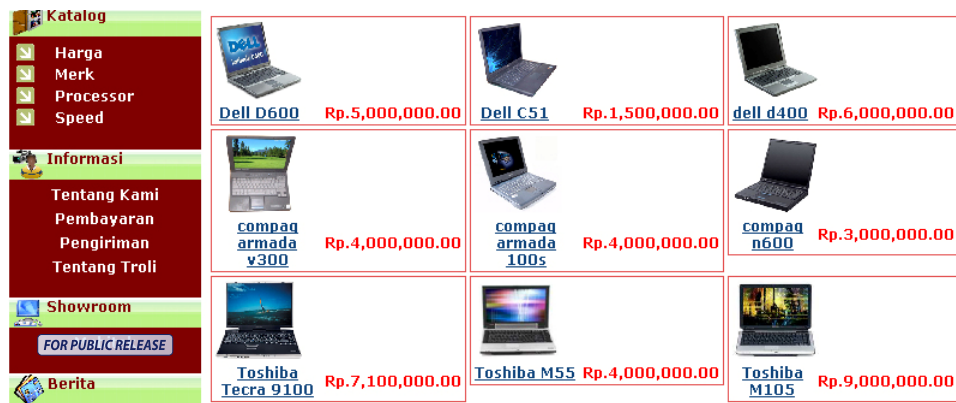
Gambar 1.1 Pemilihan produk dari halaman utama